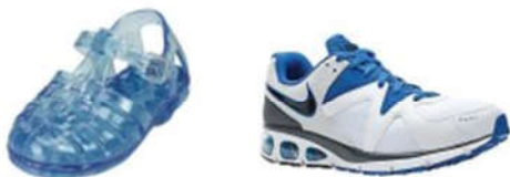
Plastic Sandaal/waterschoen Sportschoen